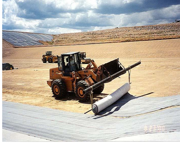
Şekil 2. Geomembran Serimi