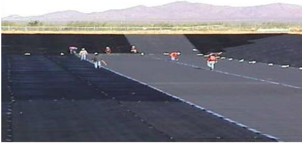
Şekil 4. Geotekstilin Serimi