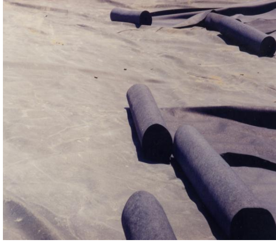
Resim 7. Geotekstil Serimi