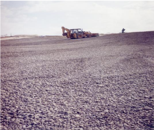
Resim 9. Drenaj Tabakası İşlemleri