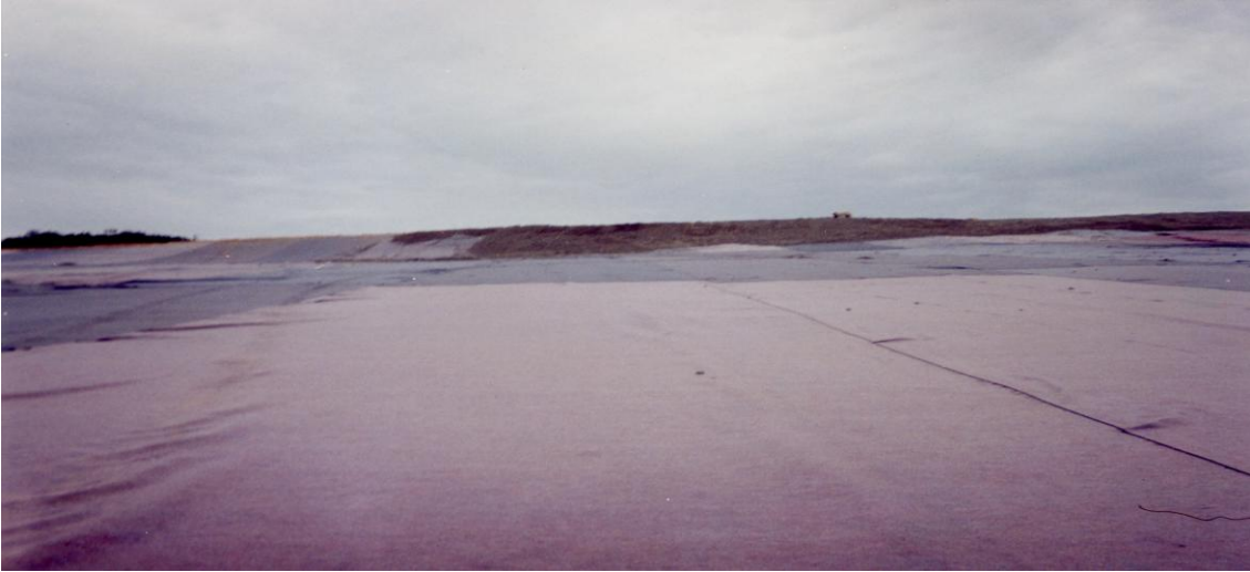
Resim 8. Geotekstil Serimi Yapılmış Sahanın Genel Görünümü