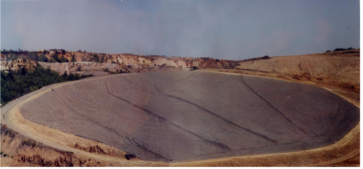
Resim 13. Katı Atık Dökümüne Hazır Sahanın Genel Görünümü