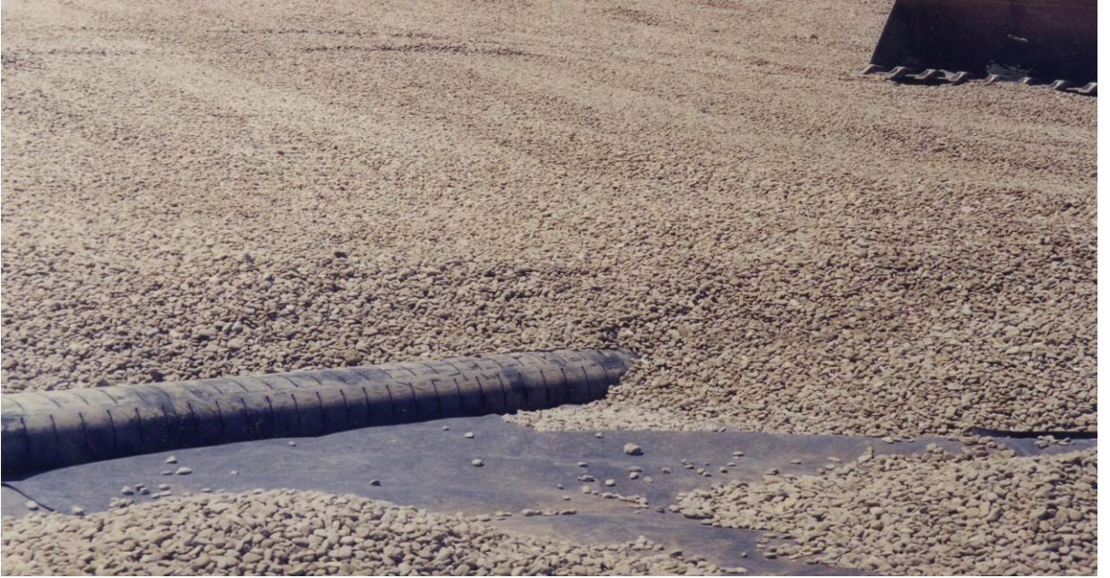
Resim 12. Sızıntı Suyu Dren Borularının Yerleştirilmesi