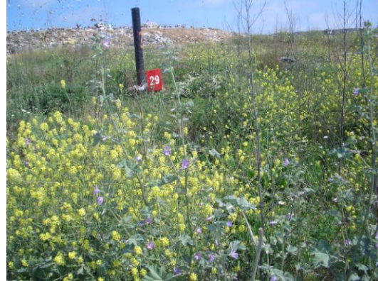
Şekil 5 Gaz Toplama Bacaları (İstaç,Kömürcüoda)