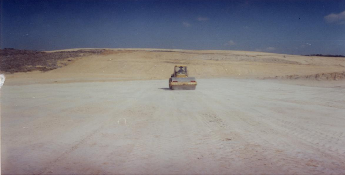
Şekil 1.Kil Geçirimsizlik Tabakasının Serilmesi İşlemi (İSTAÇ,Kömürcüoda)