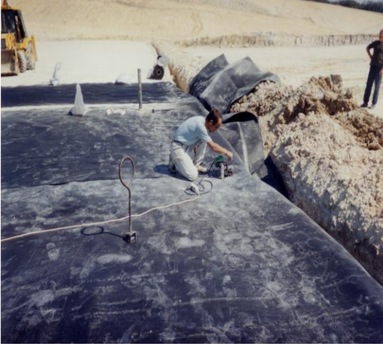
Resim 6. Geomembran Kaynak İşlemleri