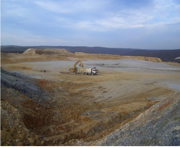
Resim 1. Harfiyat Çalışmaları