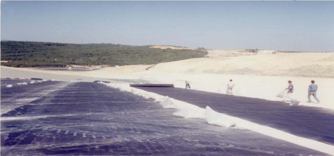
Resim 5. Geomembran Serimi