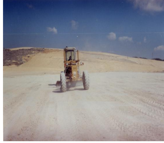
Resim 2. Kilin Tesviyesi