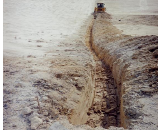
Resim 4. Ankraj Hendeği