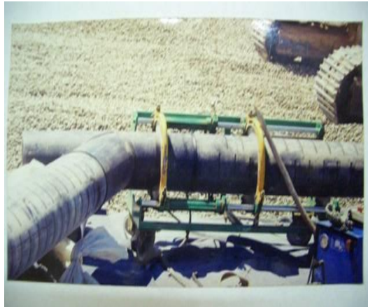
Resim 10. Sızıntı Suyu Borularının Kaynak İşlemleri