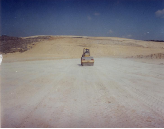
Resim 3. Kilin Sıkıştırılması