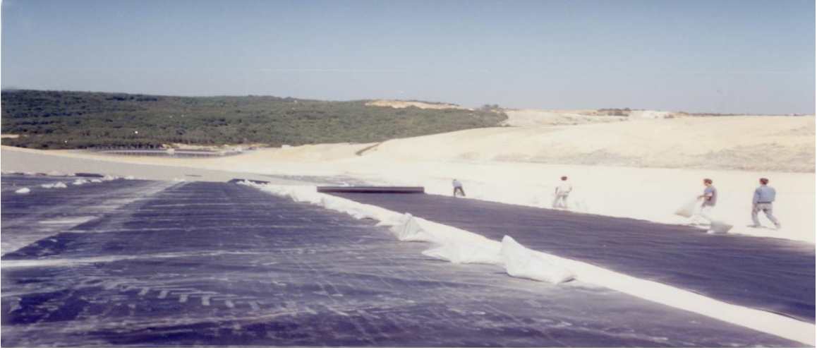
Şekil 3. Geomembranın Serimi (İSTAÇ, Kömürcüoda)

Hiç bir ekipman yada alet, geomembranı taşıma ve kullanım sırasında, yada başka sebepler ile geomembrana zarar vermemelidir. (Şekil 2) Geomembran üzerinde çalışırken sigara içilmemeli ve geomembrana zarar verecek ayakkabı giyilmemeli ve başka faaliyetlerde bulunulmamalıdır.