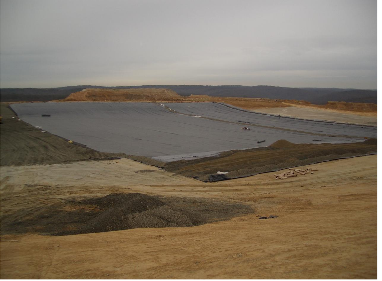
Resim 11. 30 cm Drenaj (ÇAKIL) Tabakasının Oluşturulması