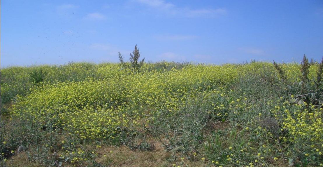
Şekil 5.Yağmur Suyunun Kontrolü İçin Üst Örtüsü Yapılmış Ve Yeşillendirilmiş Alanın Görünümü (Kömürçüoda)