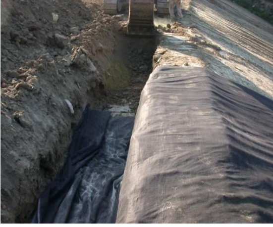
Şekil 1. Ankraj Hendeği